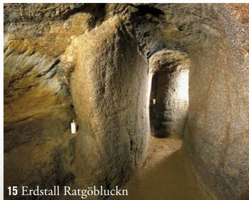
15 Erdstall Ratgöbluckn