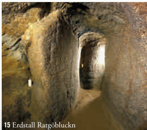
15 Erdstall Ratgöbluckn